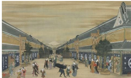
駿河町越後屋正月風景図 鳥居清長筆